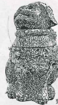
鷲峯神社狛犬(うん形)